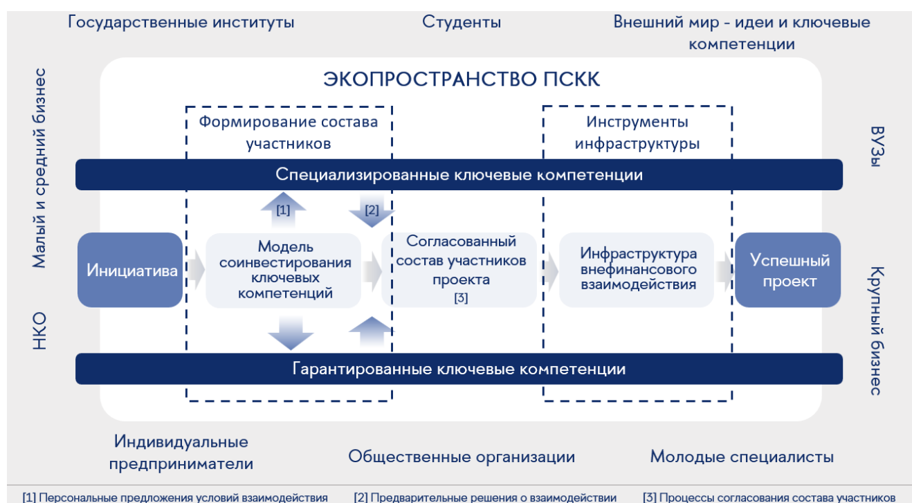
Рис. 1 – Экопространство ПСКК