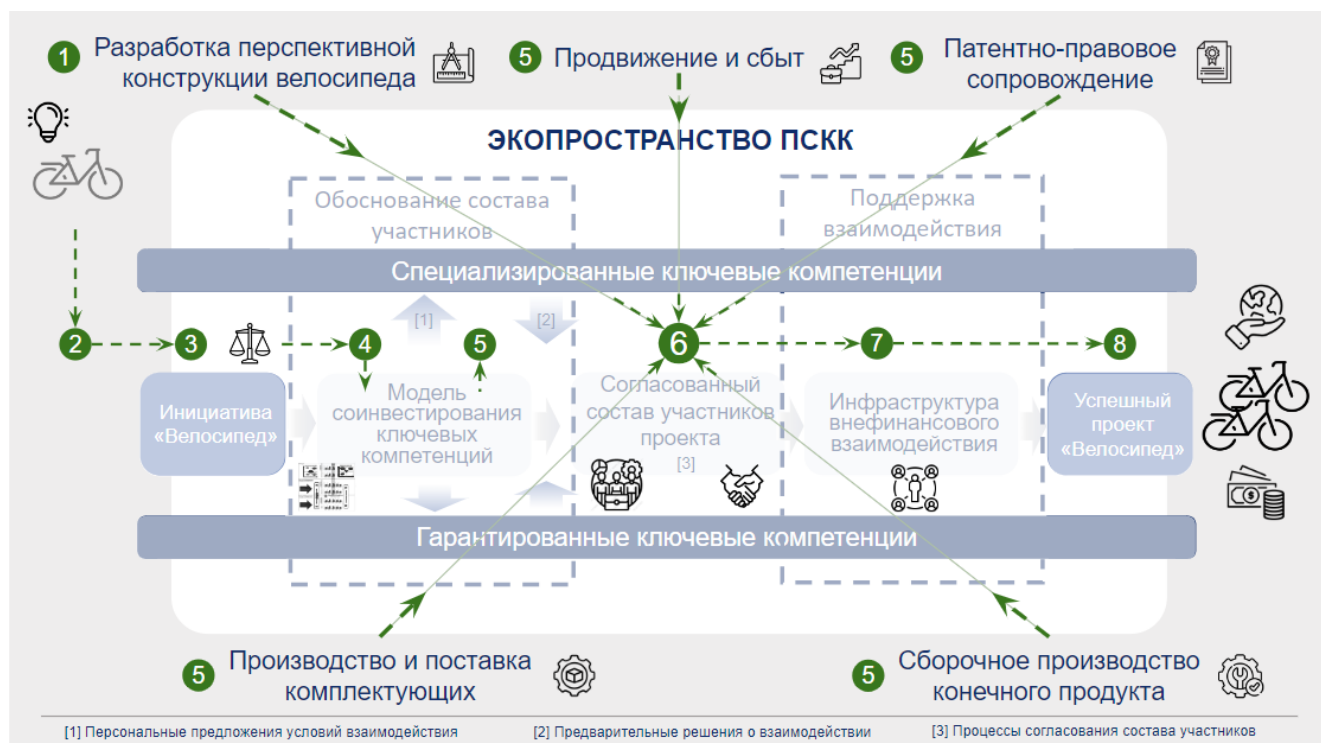
Рис. 2 – Бизнес-инициатива «Велосипед»

На рис. 2 представлен пример реализации бизнес-инициативы «Велосипед» в экоспространстве ПСКК.